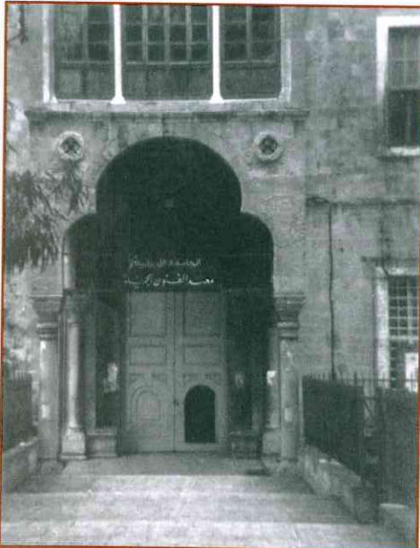
معهد الفنون الجميلة ١٩٧٤