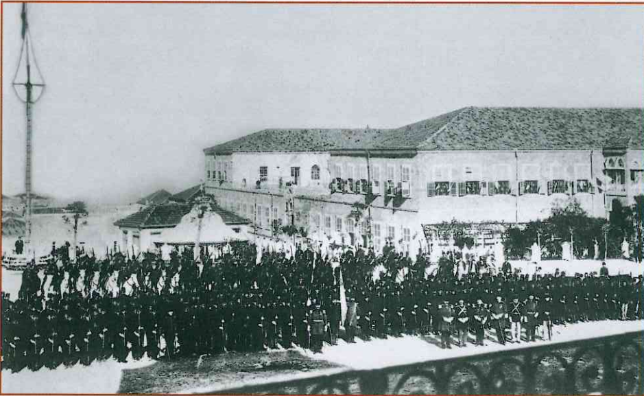
▲ مراسم الاحتفال العام أمام الخسته خانم أو المستشفى العسكري (١٩٠٠)