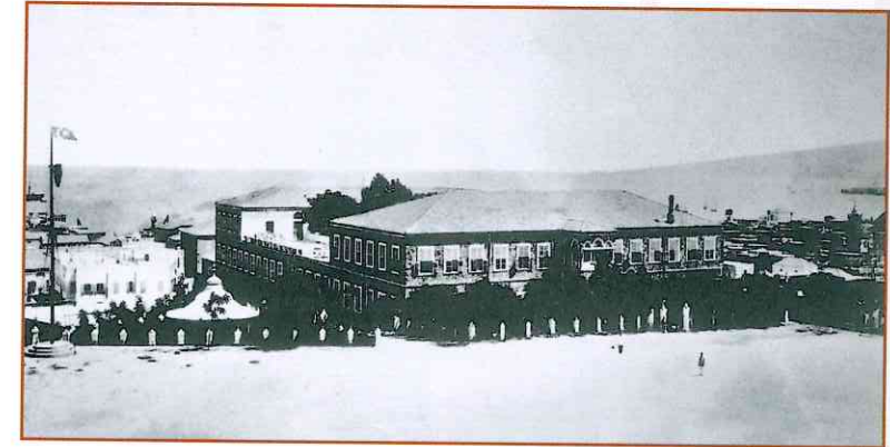
حديقة المستشفى بعد إنتهاء أعمال التسوير (١٨٩٥)