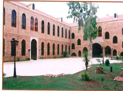
مبنى مجلس الإنماء والإعمار (١٩٩٢)