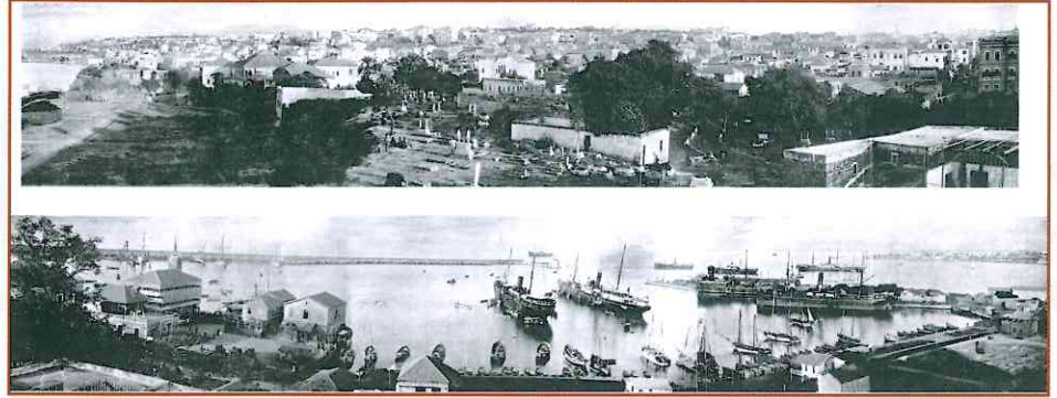
صورتان بانوراميتان لبيروت (١٩٠٨)