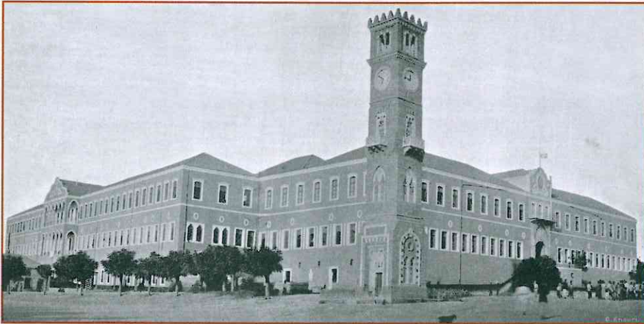
القشلة الهمايونية والساعة الحميدية (١٩٠٨)