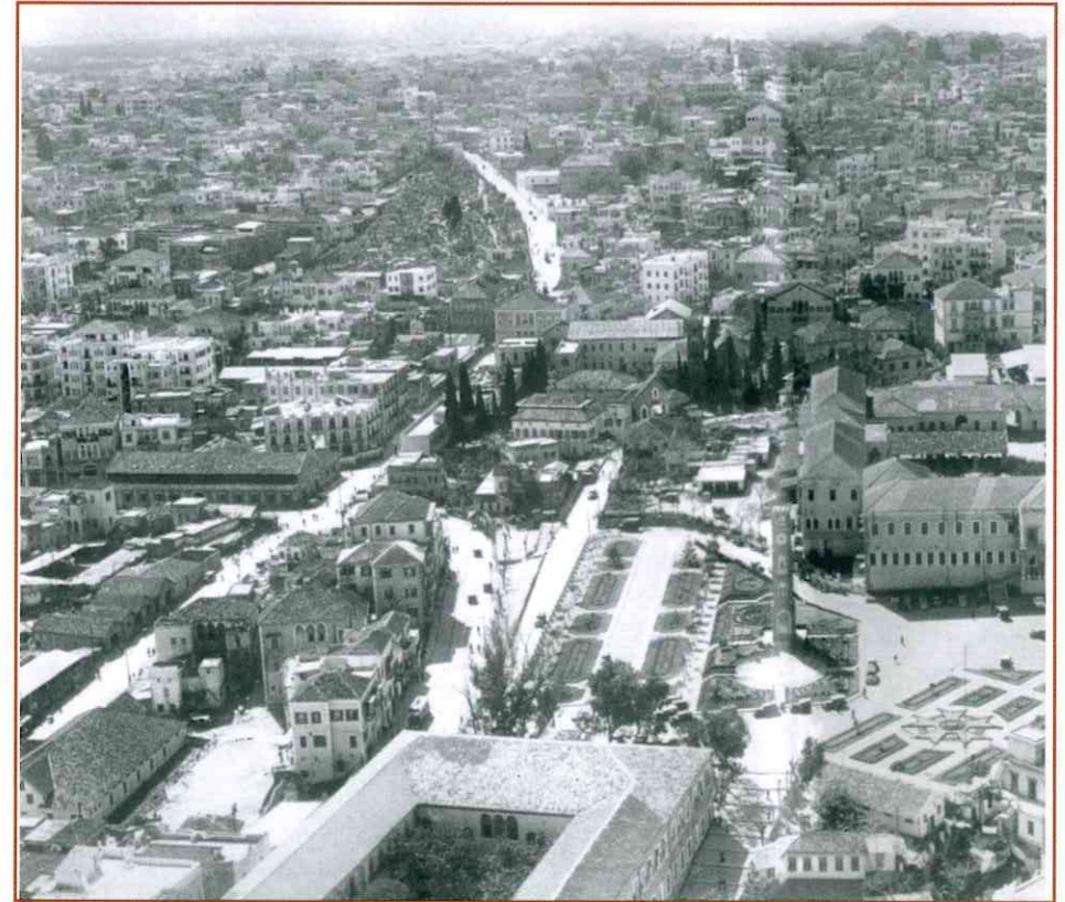
منظر بانورامي للثكنة (السراي الكبير) والساعة الحميدية ويظهر في أسفل شمال الصورة جزء من المستشفى العسكري (حوالي العام ١٩٢٠)