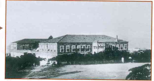
المستشفى العسكري قبل تنطيم الحديقة (١٨٨٦)